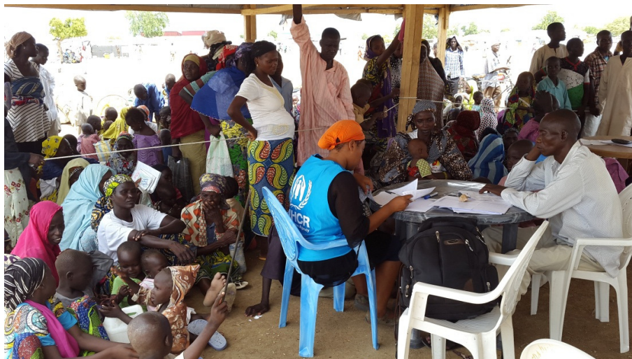
Enregistrement des réfugiés arrivés spontanément au camp de Minawao.

Dernières minutes : Suite au double attentat suicide intervenu le 22 juillet à Maroua, les Nations Unies et leurs partenaires se concertent en urgence pour envisager des mesures à adopter. Le bilan de ces attentats selon le Gouvernement est de 13 morts, dont les deux kamikazes et 32 blessés.