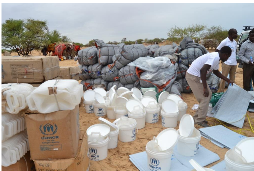
Distribution de NFI aux déplacés internes d'ethnie arabe a BagaSola