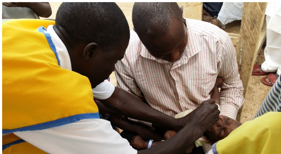
Vaccination au camp de Minawao.