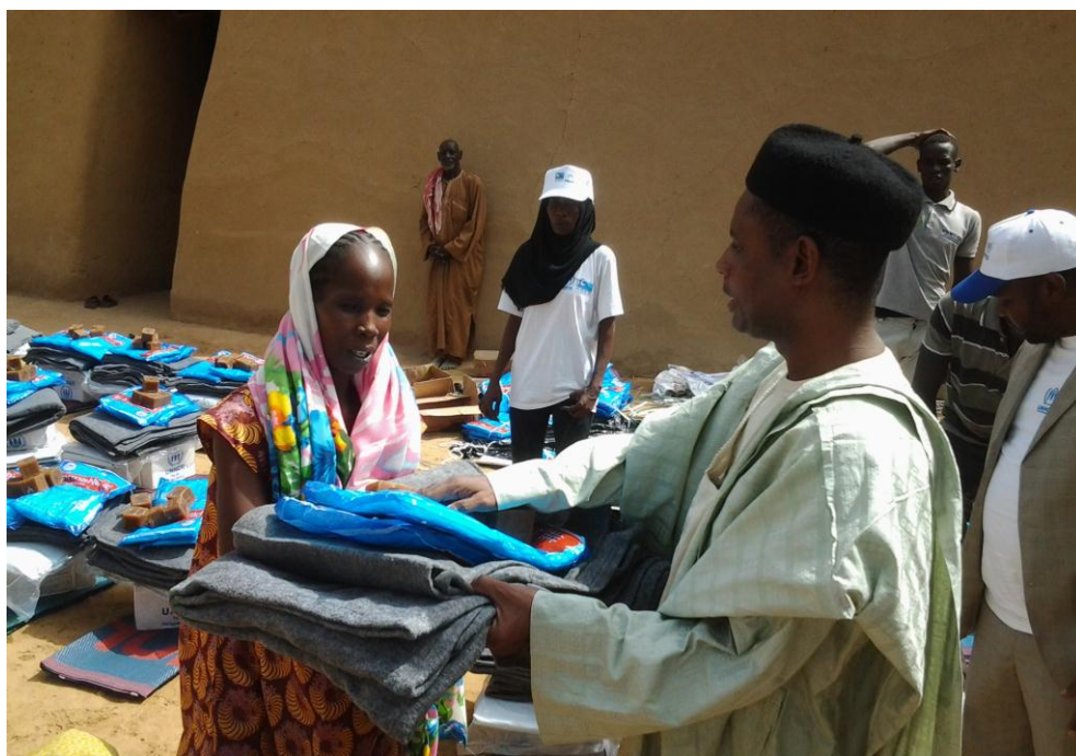
Le Sous-Préfet de Bourrah remettant un kit de biens domestiques à une femme déplacée.