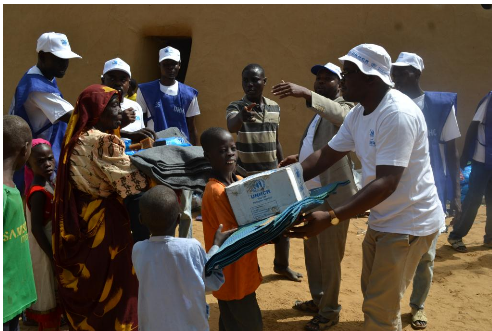
Distribution de biens domestiques aux personnes déplacées internes à Kousséri.