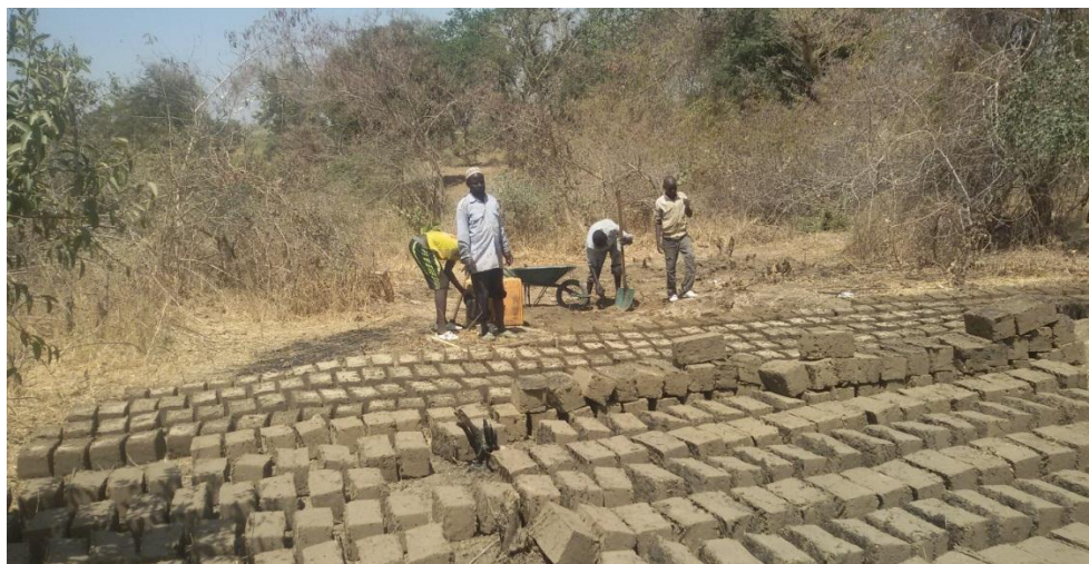
Fabrication de briques adobes par une famille déplacée de Zamaï en vue de la construction de leur abri