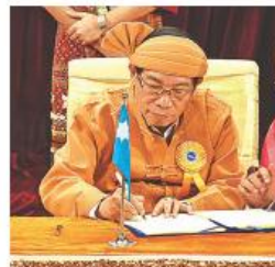
RCSS/ SSA-S Chairman U Yawd Serk