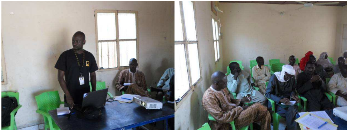
Présentation du projet 3EA à Mainé.