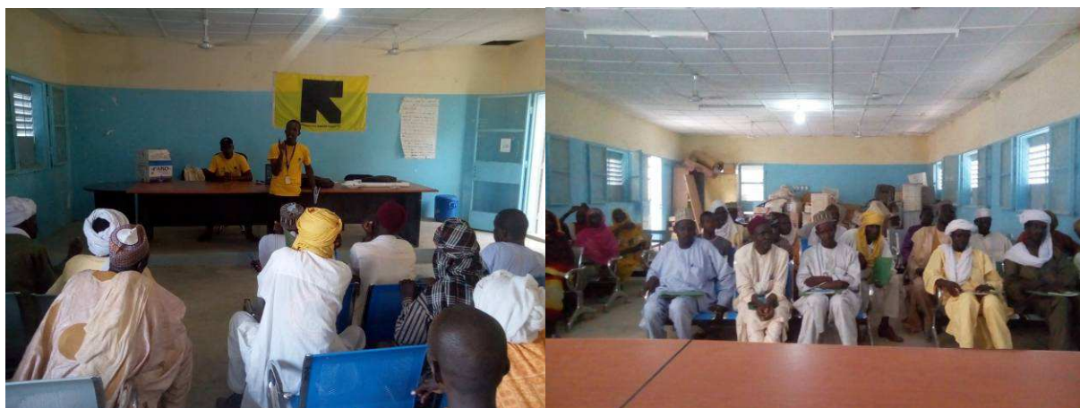
Formation des membres des structures communautaires.