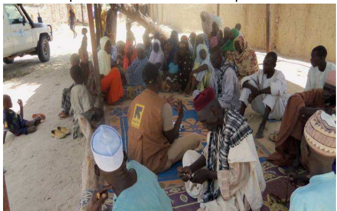
Séance de sensibilisation à Boutti.