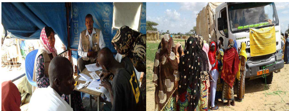
Distribution d'e-vouchers et échanges à la boutique mobile.