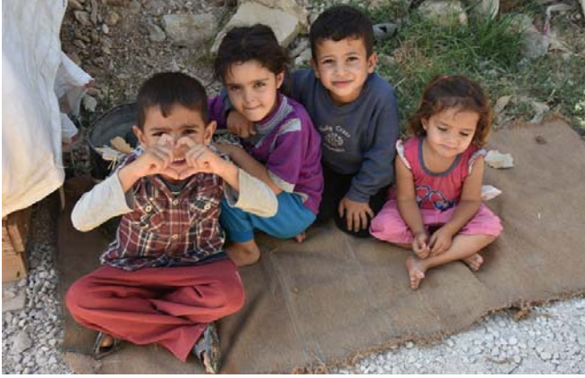
الأطفال في المخيمات العشوائية

صندوق تمويل الأنشطة الإنسانية في لبنان يخصص ١٥,٤ مليون دولار أميركي لصالح ٢٣ مشروعًا ٢٣ هو عدد المشاريع التي سوف يدعمها التخصيص المعياري الثاني لصندوق تمويل الأنشطة الإنسانية في لبنان، وذلك بإجمالي ١٥,٤ مليون دولار أميركي. وتتضمن المشاريع التي تم اختيارها مبادرات يتم تنفيذها من قبل المنظمات غير الحكومية اللبنانية والدولية بالإضافة إلى مؤسسات الأمم المتحدة.