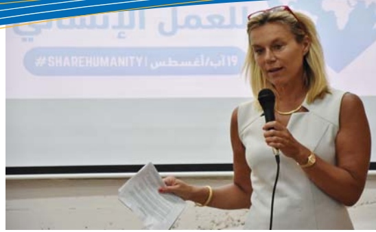
المنسقة الخاصة للأمم المتحدة في لبنان سيفريد كاغ تتحدث في احتفال اليوم العالمي للعمل الإنساني في بيروت.