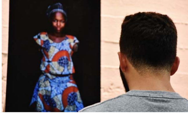
أحد المشاركين ينظر إلى صورة في معرض الصور الفوتوغرافية الذي أقيم في إطار اليوم العالمي للعمل الإنساني - المصدر: مكتب تنسيق الشؤون الإنسانية.

لعرض الحقائق والأرقام الرئيسية في كافة أرجاء مكان انعقاد الاحتفال باليوم العالمي للعمل الإنساني، وذلك لحث المعنيين بالشؤون الإنسانية وعامة الناس على بذل المزيد من الجهود في هذا المجال. هذا وقد تم عرض فيديو يبرز الإحصائيات الرئيسية التي تعكس الاحتياجات الإنسانية في جميع أنحاء العالم.