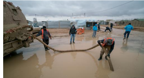
الطين والكدار المترسبة كمخلفات (.. من الشوارع التي غمرت) "desludging إزالة الحماة" الفاضلات في مخيم الزعتري.

للإطلاع على التقرير الكامل، يُرجى زيارة الموقع الإلكتروني: http://data.unhcr.org/syrianrefugees/regional.php