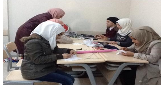
دورة الحياكة والنسيج في المركز الاجتماعي في أنطاكية/ هاتاي

* نظراً لحساسية الحالة، استبدلنا الاسم الحقيقي للشخص بالأحرف الأولى من اسمه (ي.س.).