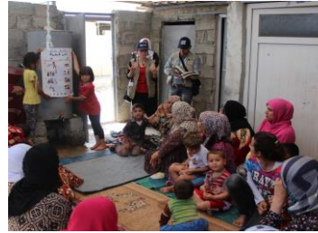
جلسات من حملة المحافظة على المياه في محافظة أربيل.

وفي مخيم الزعتري، تواصلت أعمال بناء المرحلة الأولى من شبكة الصرف الصحي، بالإضافة إلى تركيب 97% من الخزانات، وتوصيل 9,936 أسرة بالخزانات (94% من المستهدفين). وقد أدى ذلك إلى الحد من تسرب مياه الصرف الصحي بشكل كبير إلى باطن الأرض. وقد اعتمدت هيئة إدارة المياه الأردنية على تصميم المرحلة الثانية من الشبكة. وأُجريت الجهات المشاركة في الاستجابة مراجعة للنفايات الصلبة في المخيم، وتجهز لتنفيذ منهجيات بديلة لعام 2017 من خلال إعادة التدوير، ومشاركة البلديات.