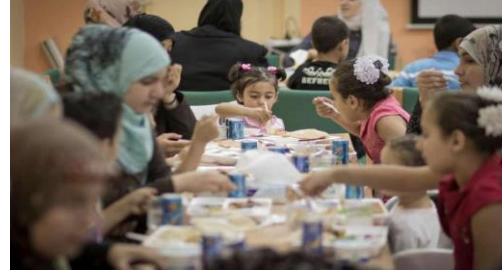
عائلة سورية أثناء الإفطار في الأردن

ويشهد عدد الوجبات المطبوخة التي يتناولها اللاجئون في لبنان يومياً انخفاضاً كبيراً. وفي عام 2015، وهو أحدث عام للبيانات المتوفرة، أشارت البيانات إلى أن واحداً من أصل ثلاثة من أفراد العائلة يأكلون وجبة واحدة مطبوخة يومياً؛ مقارنة بفرد واحد من أصل أربعة في العام الماضي. وقد نتج عن تزايد نسبة الفقر نقص في عادات تناول الطعام المُغذي؛ حيث يُفيد 60% من الأسر بأنهم لم يستطيعوا تناول الفاكهة أو الخضراوات يومياً في العام الماضي.