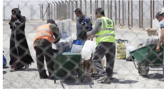
تزويد اللاجئين السوريين حديثاً الوصول إلى مخيم الأزرق / الأردن، بالغذاء، الماء، الخيم والمأوى فور وصولهم للمخيم.