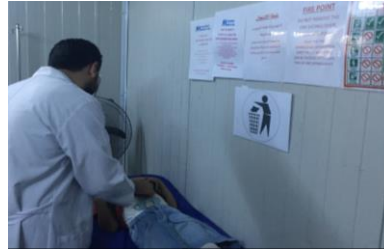
استمرار عمليات تسليم مراكز الرعاية الصحية لوزارة الصحة في مخيم ناراشكران، محافظة أربيل

وفي مصر، يواصل الشركاء العمل عن كثب مع وزارة الصحة والسكان لدمج الأنشطة النفسية الاجتماعية في الخدمات الصحية المقدمة للاجئين السوريين في الوحدات الصحية الأساسية، وتعزيز قدرة العاملين في مجال الصحة بالمجتمع فيما يتعلق بالمراقبة والدعم.