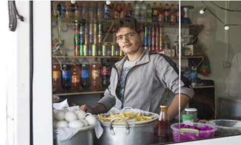
منظر عام من المخازن في شارع الشانزليزيه، في مخيم الزعري، الأردن، والذي يتوفر فيه 3,000 متجر في جميع أنحاء المخيم.

وفي الوقت الذي تدخل فيه الحرب السورية عامها السادس، يؤكد التقييم على أهمية زيادة استثمار بناء القدرة على التكيف، والجمع بين جهود مجموعة كبيرة من الجهات الوطنية والدولية المشاركة، ومنها الجهات المشاركة في القطاع الخاص والتنمية. وتقدم هذه الدراسة توجيهاً عملياً نحو الممارسات النافعة (وغير النافعة)؛ لتوجيه العمل في المنطقة وعلى المستوى القطري.