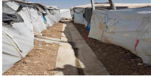
بناء قنوات صرف مكشوف جديدة خلف الملاجئ وعلى جوانب الطرق في مخيم Domiz 1 في دهوك. المفوضية السامية للأمم المتحدة لشؤون اللاجئين/ العراق / 2016

وتُجرى مشاريع مختلفة لتحسين فرص الحصول على خدمات المياه والصرف الصحي ومرافقها في 15 مدرسة للطلبة الأردنيين واللاجئين في البادية. وقد بدأ العمل بالفعل في ثلاث مدارس، ومن المُتوقّع أن يصل عدد المستفيدين من تلك الخدمات إلى حوالي 3,000 طالب وطالبة. وسيكون في كل مدرسة من المدارس حَمَام بنسبة مراحل، وخمسة صنادير مياه. وقد اختيرت المدرسة من قاعدة بيانات تحتوي على معلومات جُمعت خلال التقييم المُشترك بين منظمة الأمم المتحدة للطفولة والحكومة الأردنية لخدمات المياه والصرف الصحي والنظافة الصحية؛ وانتهى هذا التقييم في شهر يونيو. وتُستخدم قاعدة البيانات نظاماً تصنيفياً لترتيب 3,681 مدرسة وفقاً لأولويات التدخلات.