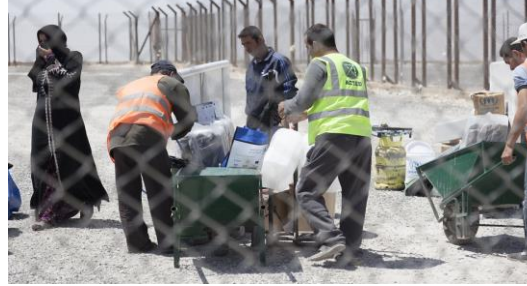
تزويد اللاجئين السوريين حديثاً الوصول إلى مخيم الأزرق / الأردن، بالغذاء، الماء، الخيم والمأوى فور وصولهم للمخيم.