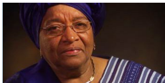
Ellen Johnson Sirleaf, Président CEDEAO

«Nous félicitons le peuple gambien pour son engagement ferme et son ardent désir de poursuivre des objectifs démocratiques, comme cela a été démontré récemment lors des élections générales et présidentielles»