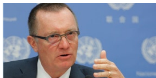
Jeffrey Feltman, ASG Affaires Politiques

La transition en Gambie est «un cas très évident de prévention», dans lequel la Communauté Economique des États de l'Afrique de l'Ouest (CEDEAO), l'Union africaine (UA) et l'ONU étaient «unies derrière la volonté du peuple gambien».