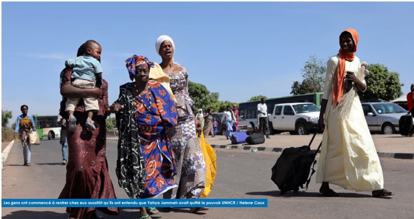
Les gens ont commencé à rentrer chez eux aussitôt qu'ils ont entendu que Yahya Jammeh avait quitté le pouvoir

Plusieurs milliers de personnes sont rentrées en Gambie depuis que le Président sortant, Yahya Jammeh a quitté le pouvoir.