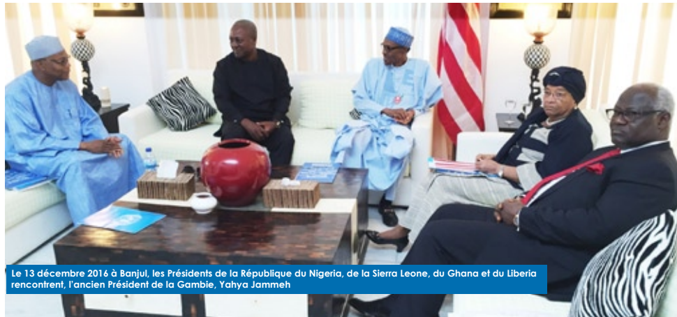
Le 13 décembre 2016 à Banjul, les Présidents de la République du Nigeria, de la Sierra Leone, du Ghana et du Liberia rencontrent, l'ancien Président de la Gambie, Yahya Jammeh

Le 1er décembre 2016, lors d'une élection décisive et après plus de deux décennies d'un régime autoritaire, les Gambiens ont pacifiquement exprimé leurs aspirations au changement... Lire la suite P.5