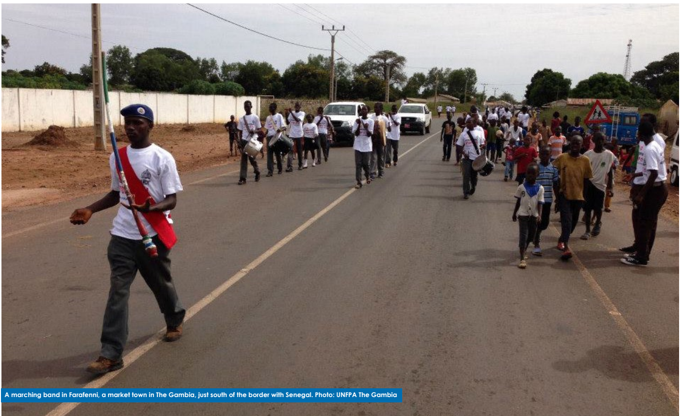
A marching band in Farafenni, a market town in The Gambia, just south of the border with Senegal.