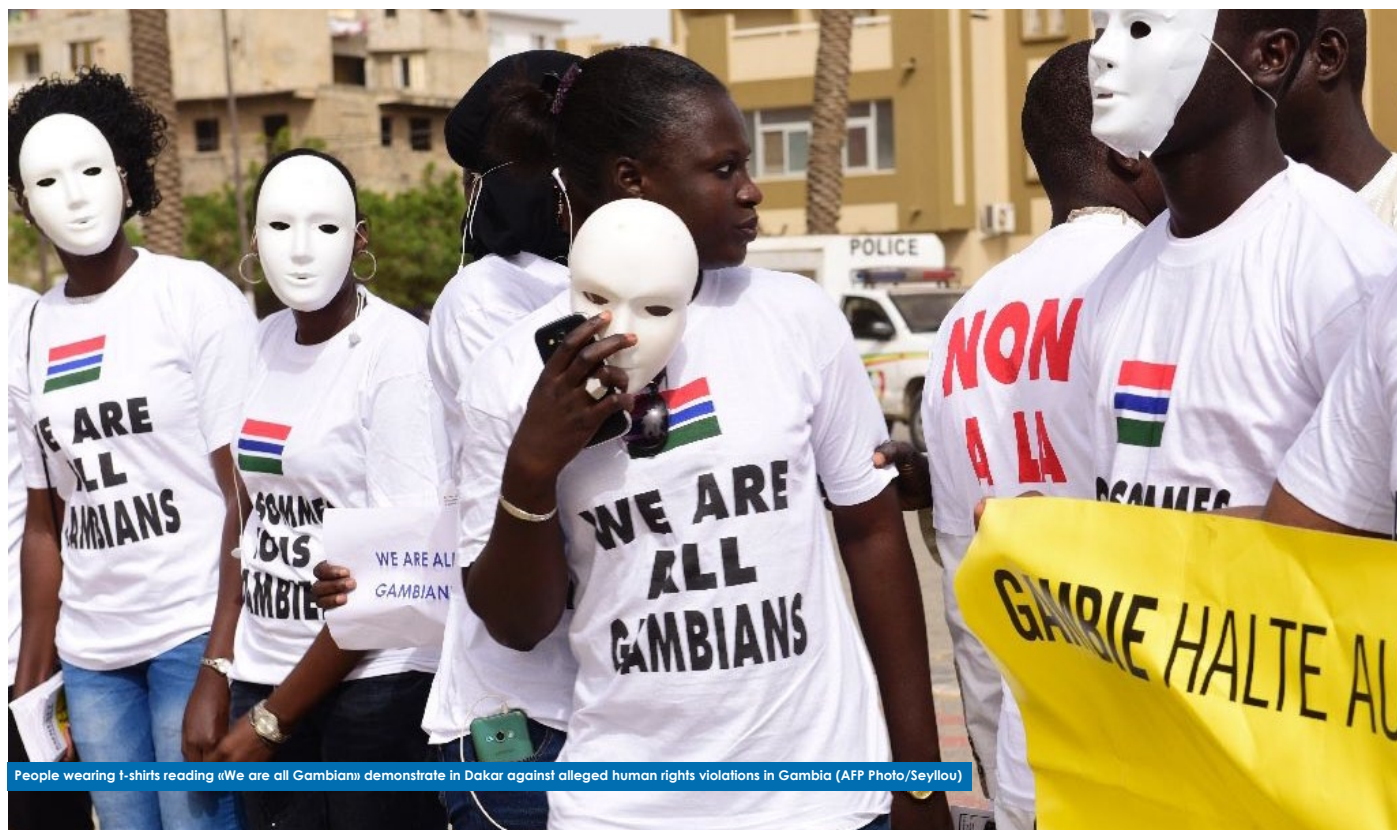
People wearing t-shirts reading «We are all Gambians» demonstrate in Dakar against alleged human rights violations in Gambia

Avec le départ de M. Jammeh et l'investiture du Président Adama Barrow, une nouvelle ère de respect des droits humains commence.