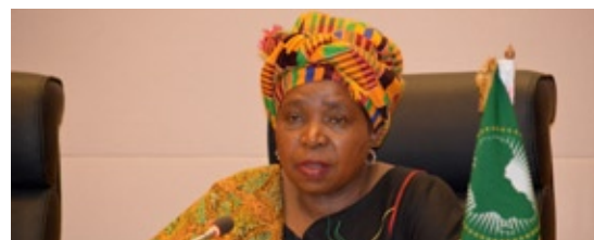
Dr. Nkosazana Dlamini Zuma: UA

La transition est significative dans la mesure où elle est le premier transfert pacifique de pouvoir dans la République islamique de Gambie depuis l'indépendance du pays en 1965.