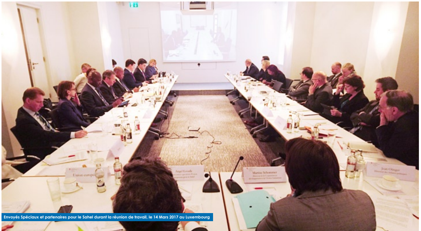
Envoyés Spéciaux et partenaires pour le Sahel durant la réunion de travail, le 14 Mars 2017 au Luxembourg