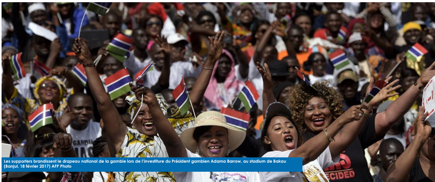
Les supporters brandissent le drapeau national de la Gambie lors de l'investiture du Président gambien Adama Barrow, au stadium de Bakau (Banjul, 18 février 2017)

Le 1er décembre 2016, lors d'une élection décisive et après plus de deux décennies d'un régime autoritaire, les Gambiens ont pacifiquement exprimé leurs aspirations au changement.