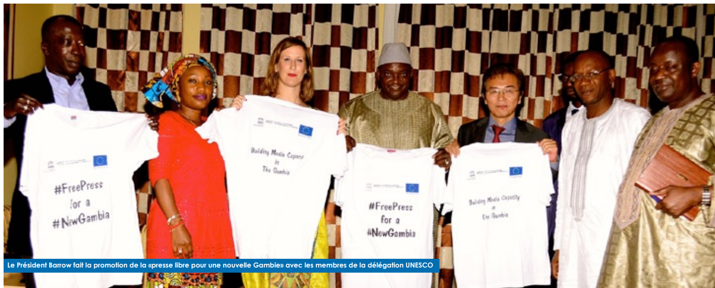
Le Président Barrow fait la promotion de la «presse libre pour une nouvelle Gambie» avec les membres de la délégation UNESCO

Les professionnels des médias en Gambie sont aujourd'hui mieux équipés pour transmettre à leurs communautés les informations dont elles ont besoin pour construire une société informée et tournée vers l'avenir. Grâce à l'octroi, par l'Union européenne, d'une subvention de 691,583 euros, l'UNESCO renforce les capacités des médias gambiens en fournissant des équipements et en favorisant le développement de l'enseignement du journalisme et d'un environnement propice à la liberté d'expression et à l'accès à l'information.