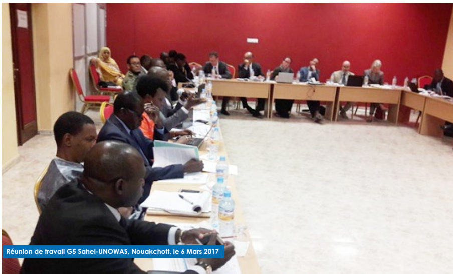
Réunion de travail G5 Sahel-UNOWAS, Nouakchott, le 6 Mars 2017

La coopération initiée depuis plus de deux ans entre le G5 Sahel (Mauritanie, Burkina Faso, Mali, Tchad et Niger) et les Nations Unies témoigne de la volonté des deux organisations de travailler ensemble pour faire face aux défis qui freinent le développement des cinq pays sahéliens.