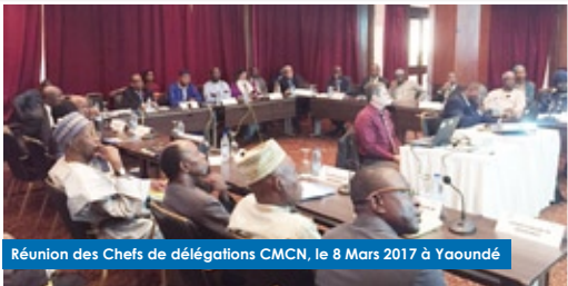
Réunion des Chefs de délégations CMCN, le 8 Mars 2017 à Yaoundé

Une réunion extraordinaire des chefs des délégations de la Commission Mixte Cameroun-Nigeria (CMCN) s'est tenue le 8 mars 2017 à Yaoundé... Lire la suite P.19