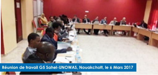
Réunion de travail G5 Sahel-UNOWAS, Nouakchott, le 6 Mars 2017

La coopération initiée depuis plus de deux ans entre le G5 Sahel (Mauritanie, Burkina Faso, Mali, Tchad et Niger) et les Nations Unies témoigne de la volonté des deux organisations de travailler ensemble... Lire la suite P.17