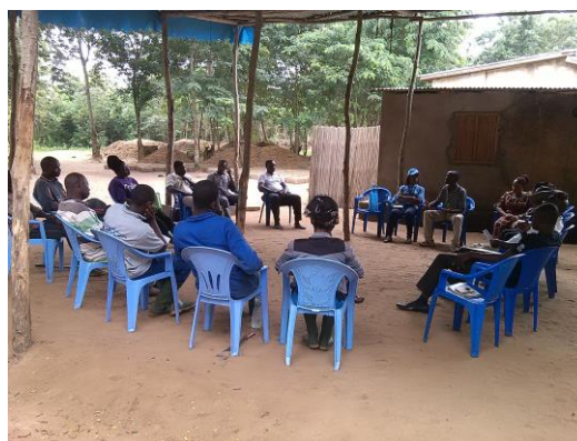
Réfugiés et autochtones en causerie sur la cohésion sociale à Bolou-Kpodavé au Sud du Togo