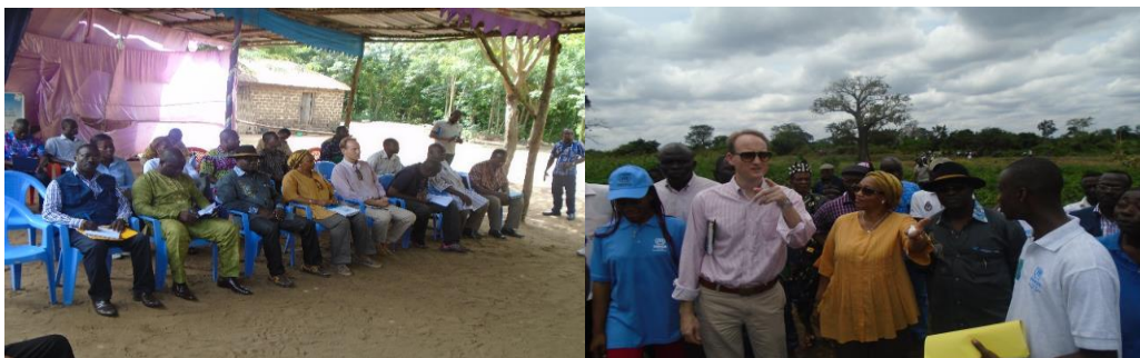
La délégation officielle en réunion avec les bénéficiaires du projet à Bolou. Sur le site, la Représentante du HCR au Togo, le Coordonnateur Régional BPRM pour la question des réfugiés et le DC/Action Sociale.

Le Jeudi 28 septembre 2017, M. Skye accompagné de la Représentante du HCR au Togo s'est rendu sur le site du projet agropastoral, à Bolou-Kpondavé (Préfecture du Zio) au sud Togo. Plusieurs autorités gouvernementales au rang desquelles, le Directeur du Cabinet (DC) du Ministère de l'Action Sociale, de la Promotion de la Femme et de l'Alphabétisation, le Secrétaire Général de la Préfecture du Zio et des cadres d'autres ministères tels que les Ministères de l'Agriculture et de la sécurité ont pris part à cette visite de terrain dans la collectivité de Bolou où se passent les activités d'intégration locale.