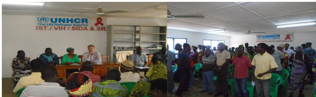
La mission en réunion d'échanges avec les réfugiés ivoiriens du camp d'Avépozo

Le Vendredi 29 septembre 2017, la mission a rencontré les réfugiés ivoiriens au camp d'Avépozo avec qui elle a échangé longuement sur le même sujet. Au cours de cette rencontre, la Représentante du HCR au Togo et M. Skye ont livré le même message de rapatriement volontaire et l'intégration locale comme les seules solutions durables encore possibles. La mission a sensibilisé les réfugiés dans ce sens et les a même informés de la probable déclaration de la clause de cessation qui mettra fin au statut prima facie des ivoiriens dans la sous-région.