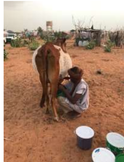
المفوضية تدعم إنتاج الحليب من أجل مكافحة سوء التغذية في مخيم مبيرا.