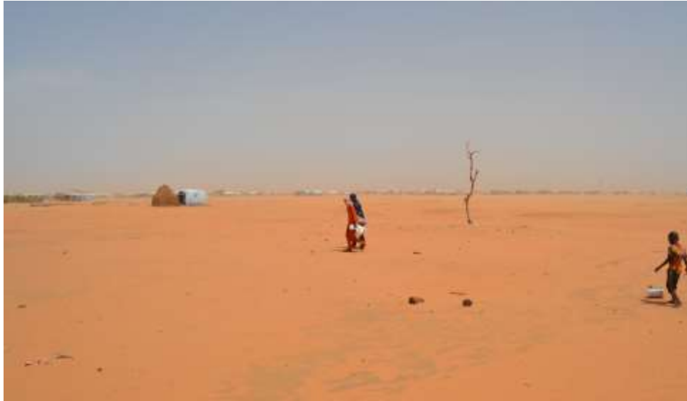
تؤثر الظروف المناخية القاسية في جنوب شرق موريتانيا على الحياة اليومية في مخيم مبيرا.

تقود المفوضية الاستجابة الإنسانية للاجئين الماليين في منطقة الحوض الشرقي منذ 2012 بالتعاون مع الحكومة الموريتانية التي تبقى حدودها مفتوحة أمام التدفقات الجديدة، وبالتنسيق مع وكالات الأمم المتحدة الأخرى والمنظمات غير الحكومية الوطنية والدولية. وعلى الرغم من إبرام اتفاقية سلام في مالي في يونيو 2015، من غير المتوقع بعد أن تحدث حركات عودة كثيفة للاجئين بسبب الوضع الأمني في شمال مالي. في يونيو 2016، أبرمت موريتانيا ومالي والمفوضية اتفاقية ثلاثية لإعادة الطوعية للاجئين الماليين. وعندما تسمح الظروف بالعودة، ستوفر هذه الاتفاقية إطاراً لتسهيل العودة الطوعية. وحتى ذلك الحين، هي تعيد التأكيد على التزام موريتانيا ومالي بحماية اللاجئين.