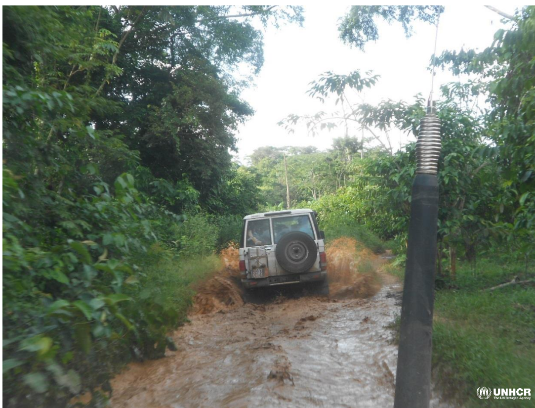
Route en mauvaise état suite aux fortes pluies dans la zones de retour de Zehipleu