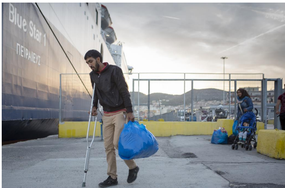
Ένας αιτών άσυλο στη Λέσβο ετοιμάζεται να επιβιβαστεί στο πλοίο για την Αθήνα. Οκτώβριος 2017.