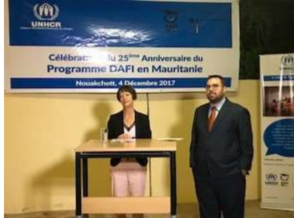
سعادة السفيرة كارولا مولر هولتكمبر، سفيرة ألمانيا في موريتانيا تقدم برنامج DAFI بمناسبة الذكرى 25 للبرنامج في السفارة الألمانية في نواكشوط.

تستمر المفوضية وشركاؤها في محاربة الأمية في مخيم مبيرا. في نوفمبر، حضر 205 أشخاص راشدين دورات لتعلم القراءة والكتابة في 4 لغات (التماشقية