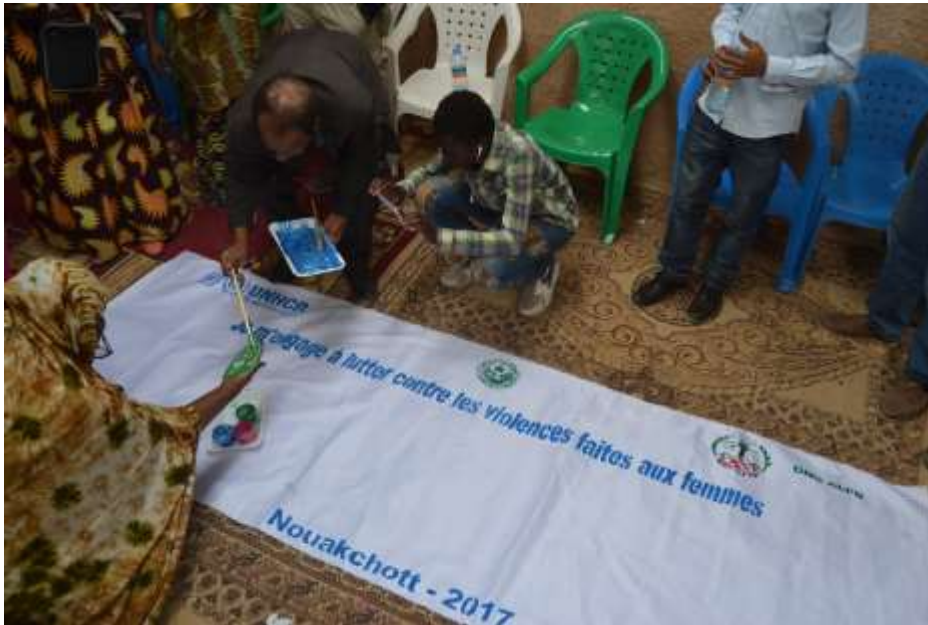
إطلاق حملة "16 يوماً من النشاط" لوضع حد للعنف القائم على نوع الجنس.

تقود المفوضية الاستجابة الإنسانية للاجئين الماليين في منطقة الحوض الشرقي منذ 2012 بالتعاون مع الحكومة الموريتانية التي تبقى حدودها مفتوحة أمام التدفقات الجديدة، وبالتنسيق مع وكالات الأمم المتحدة الأخرى والمنظمات غير الحكومية الوطنية والدولية. وعلى الرغم من إبرام اتفاقية سلام في مالي في يونيو 2015، من غير المتوقع بعد أن تحدث حركات عودة كثيفة للاجئين بسبب الوضع الأمني في شمال مالي. في يونيو 2016، أبرمت موريتانيا ومالي والمفوضية اتفاقية ثلاثية للإعادة الطوعية للاجئين الماليين. وعندما تسمح الظروف بالعودة، ستوفر هذه الاتفاقية إطاراً لتسهيل العودة الطوعية. وحتى ذلك الحين، هي تعيد التأكيد على التزام موريتانيا ومالي بحماية اللاجئين.