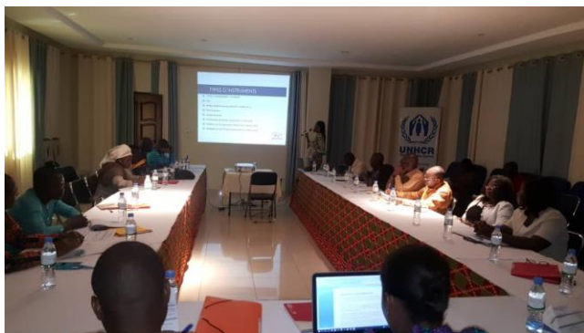
Les participants suivant attentivement les communications lors de l'atelier