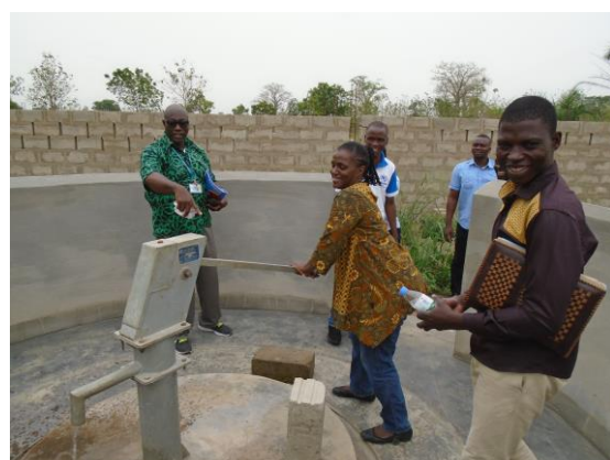
La mission testant un forage construit à Bolou-Kpondavé au profit de la communauté locale dans le cadre du projet agropastoral