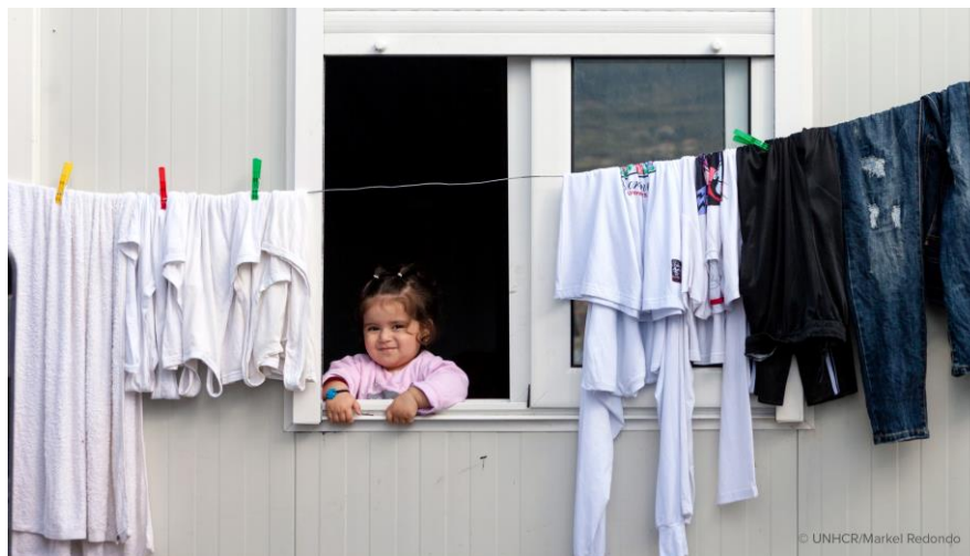
Ένα παιδί πρόσφυγας στο Κέντρο Υποδοχής και Ταυτοποίησης στο Βαθύ της Σάμου