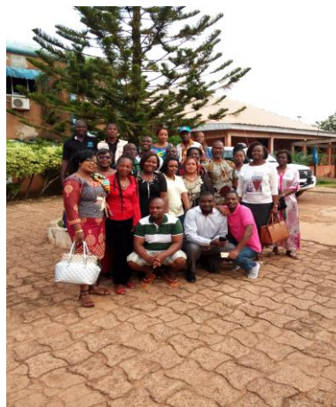
Les réfugiés ivoiriens au bureau de la préfecture de Gagnoa échangeant avec le Préfet (à gauche) et photo de famille de toute la mission