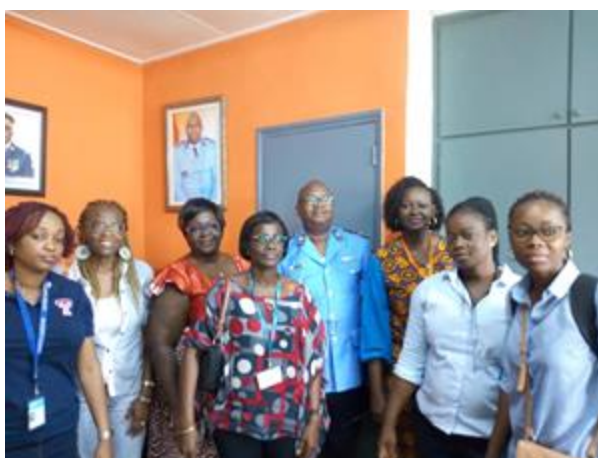
La mission du Go and See avec le Commissaire de la Commune d'Abobo au bureau du commissariat