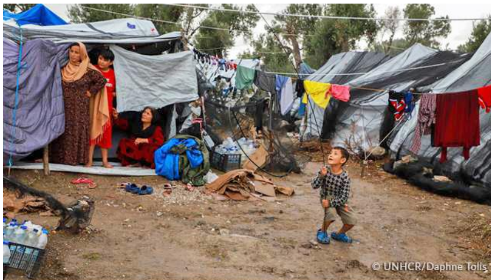
Οικογένειες που διαμένουν σε αυτοσχέδια καταλύματα έξω από το υπερπλήρες Κ.Υ.Τ. στη Μόρια της Λέσβου, εκτεθειμένες στις καιρικές συνθήκες και με περιορισμένη πρόσβαση σε εγκαταστάσεις υγιεινής και άλλου είδους υπηρεσίες

10 Γραφεία σε Θεσσαλονίκη, Λέσβο, Αττική, Χίο, Σάμο, Κω, Έβρο, Ιωάννινα, Λέρο και Ρόδο