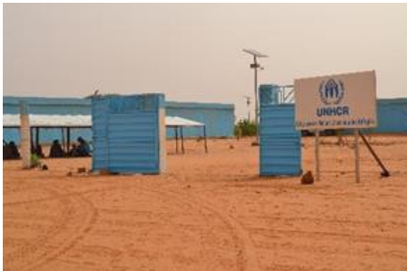
مكتب الحماية التابع للمفوضية في مخيم مبيرا.

تساعد المفوضية ما مجموعه 58,923 شخصاً في موريتانيا