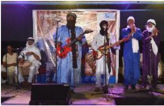
"تافلبيست"، وهي فرقة تتألف من لاجئين من مخيم مبيرا، تقدم عرضاً في نواكشوط خلال الاحتفالات بيوم اللاجئ العالمي.

في ذكرى يوم اللاجئ العالمي، نظمت المفوضية في موريتانيا فعاليات في مخيم مبيرا ومدينتي نواكشوط ونواذيبو. وفي 18 يونيو، أطلقت المفوضية بالتعاون مع المعهد الفرنسي في موريتانيا فعاليات يوم اللاجئ العالمي في نواكشوط بمناظرة حول فيلم سينمائي . وفي 20 يونيو، نظمت المفوضية وشريكها المحلي، منظمة مكافحة الفقر وتعزيز التنمية، سلسلة من الأنشطة المجتمعية في نواكشوط ونواذيبو، وقدمت فرقة من اللاجئين الماليين عرضاً في المساء في المعهد الفرنسي في نواكشوط. وفي اليوم نفسه، احتفلت المفوضية في باسيكونو بذكرى يوم اللاجئ العالمي في مخيم مبيرا. واستضافت جامعة نواكشوط الفعالية الختامية حيث نظمت المفوضية عرض فيلم تبعه نقاش مع طلاب كلية الحقوق والاقتصاد.