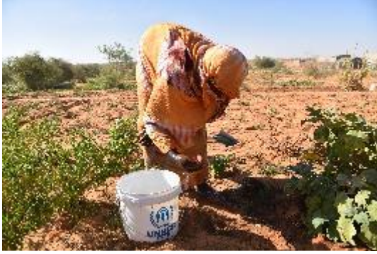
امرأة لاجئة تعمل في حديقتهما بالقرب من مخيم مبيرا

يعتمد اللاجئون في مخيم مبيرا بشكل كبير على المساعدات الغذائية بسبب الندرة الهائلة في الموارد المحلية. وتعمل المفوضية مع شركائها من أجل تحسين إمكانية الوصول إلى الحقول الزراعية والمواشي لتقليص اعتماد اللاجئين على المساعدات الغذائية. وتدعو الحاجة إلى التدخلات على صعيد التنمية في منطقة الحوض الشرقي لمساعدة مجتمعات اللاجئين والمجتمعات المستضيفة لكي تصبح أكثر قدرة على الصمود.