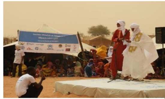
الاحتفالات بيوم اللاجئ العالمي في مخيم مبيرا.