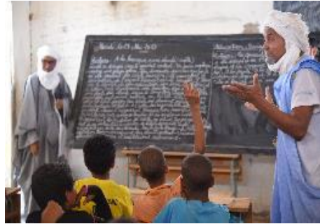
أطفال يجيبون مدرّسهم في إحدى مدارس مخيم مبيرا الست.

في مخيم مبيرا، تستمر المفوضية وإنترسوس في تقديم دورات للبالغين لتعلم القراءة والكتابة في اللغات الأربع المستخدمة في المخيم (التماشقية والعربية والسونغاي والفولانية). وفي يونيو، أجرى 255 طالباً (199 امرأة و66 رجلاً) الامتحان النهائي.