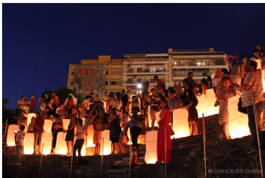
Στη Θεσσαλονίκη, κατά την Παγκόσμια Ημέρα Προσφύγων, οι εθελοντές ανάβουν φαναράκια και τηρούν ενός λεπτού σιγή εις μνήμη των χιλιάδων προσφύγων που έχασαν τη ζωή τους αναζητώντας ασφάλεια.