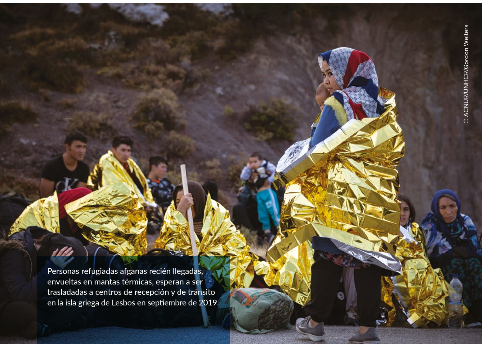
Personas refugiadas afganas recién llegadas, envueltas en mantas térmicas, esperan a ser trasladadas a centros de recepción y de tránsito en la isla griega de Lesbos en septiembre de 2019.

Las llegadas por la frontera terrestre entre Grecia y Turquía han disminuido un 30% respecto al año pasado. Los motivos de esta reducción parecen ser el aumento de las medidas preventivas en ambos lados