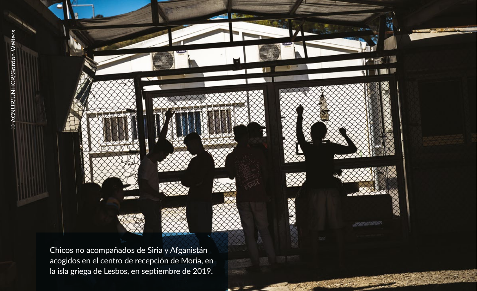
Chicos no acompañados de Siria y Afganistán acogidos en el centro de recepción de Moria, en la isla griega de Lesbos, en septiembre de 2019.