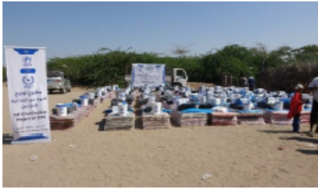
تركيب مواد غير غذائية في موقع للتوزيع في مديرية الدريهمي في محافظة الحديدة. قدمت المفوضية المساعدة إلى 277 أسرة (1,219 شخص) نزحوا بسبب النزاع، بالإضافة إلى مواد متنوعة في هذا الموقع.

بدأت حوالي 5,715 أسرة نازحة في محافظتي الحديدة وحجة بالإقامة في وحدات المأوى الطارئة لتهامة التي تم توزيعها مؤخراً. وحدات المأوى الطارئة لتهامة هي نسخة محسنة من وحدات المأوى الطارئة، مع طبقة أولى من صفائح القماش المشمع البلاستيكية المغطاة بطبقة إضافية من أوراق النخيل المحلية. هذا يساعد على الحفاظ على درجة حرارة أكثر برودة داخل وحدات الإيواء، وهو أمر ضروري للنازحين داخلياً الذين يعيشون في المناطق الحارة والرطبة. يتم تصنيع وحدات المأوى الطارئة لتهامة من حصر القصب التي يتم إنتاجها من قبل النازحين داخلياً والمجتمعات المضيفة، مما يساعد على تعزيز الاقتصاد المحلي وتوليد الدخل.