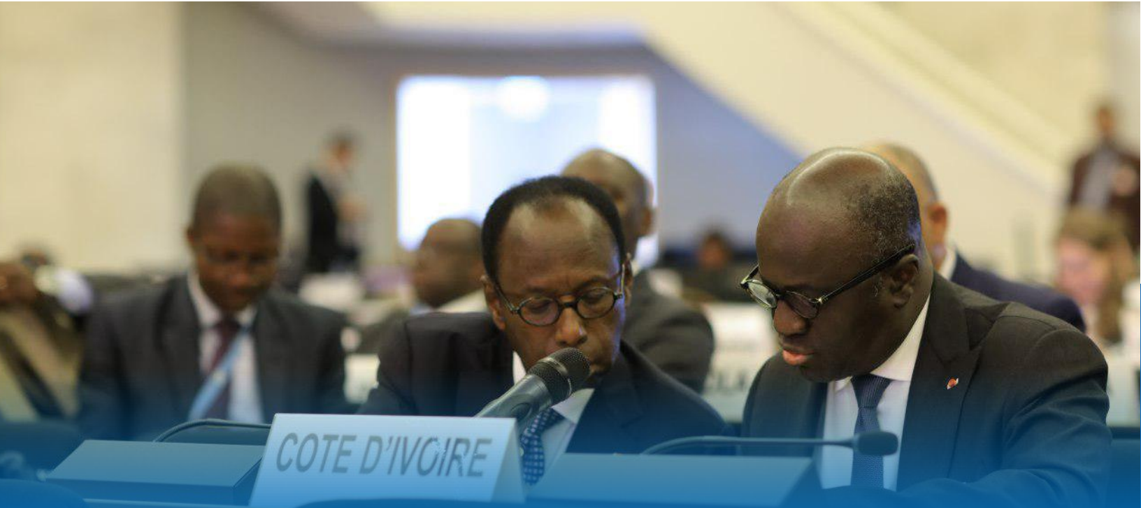
Ministre des affaires étrangères de la CIV, Monsieur Marcel Amon-Tanoh lors du Segment de Haut Niveau sur l'Apatridie, Excom 2019, Genève.