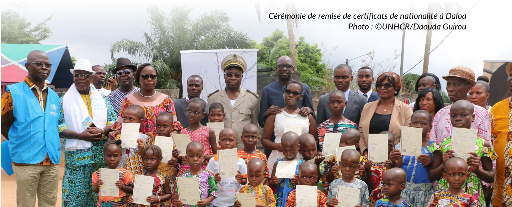
Cérémonie de remise de certificats de nationalité à Daloa

Face à cette situation, le bureau du HCR s'est évertué à renforcer les capacités des autorités judiciaires sur les outils juridiques existants (Convention de 1961, Constitution, Code de la nationalité, etc.) pour prévenir et résoudre l'apatridie chez les enfants trouvés. Cela a eu pour conséquence d'encourager certains juges à leur délivrer des certificats de nationalité. En vue de pérenniser de telles initiatives, le HCR a participé à la rédaction de la circulaire ci-dessus mentionnée et a mené un plaidoyer auprès du Garde des Sceaux, Ministre de la Justice et des Droits de l'Homme, en vue de sa signature. Celle-ci a eu lieu le 04 octobre 2019. Il s'agit d'une avancée remarquable dans la lutte contre l'apatridie en Côte d'Ivoire.