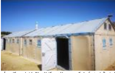
قامت المفوضية بتركيب وحدتان سكنيتان لاستخدامهم كفضول دراسية للفتيات الملتحقات بالصفوف 1-3 الابتدائية، اللواتي لا يستطيعن الذهاب إلى المدرسة بسبب المسافات الطويلة.