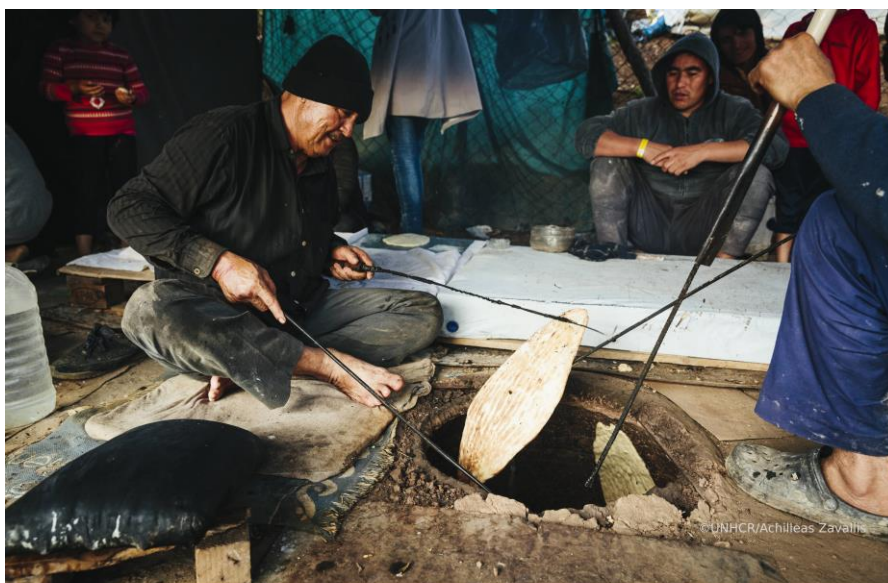
Ένας Αφγανός αιτών άσυλο ψήνει ψωμί σε έναν αυτοσχέδιο φούρνο στην άτυπη επέκταση του κέντρου υποδοχής στη Μογιά στη Λέσβο.