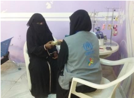
موظفو شركاء المفوضية يقدمون المساعدة النقدية الطارئة لمستفيدة في المركز المجتمعي للمشورة، بالنسبة للنازحات الطارئة، يقدم شركاء المفوضية حلولاً نقدية عاجلة تشمل التدخلات الطبية ويساعدون كذلك في حالة التهديد بالإيذاء أو أي مخاوف أخرى تتعلق بالحماية.

تم استكمال بناء 6,000 مسكن طارئ في تهامة في محافظتي حجة والحديدة وهذه المساكن المؤقتة مغطاة بأغطية محاكاة من سعف النخيل من صنع 800 نازح وأسرة من المجتمعات المضيفة تم تدريبهم على ذلك ما وفر لهم مصدراً هاماً للدخل. تساعد هذه المواد الخاصة المصنوعة من مكونات محلية على حماية النازحين من الطقس الحار حيث أن هذه المنطقة معروفة بمناخها الحار والرطب.