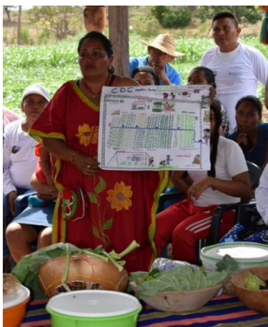
Proyecto de recuperación rápida de producción de alimentos, en el corregimiento Montelara en La Guajira.

Durante el mes de febrero, más de 331.200 beneficiarios recibieron una o más asistencias alimentarias y de nutrición a través de 48 socios e implementadores del RMRP, en un total de 47 municipios de 13 departamentos, tanto en departamentos de frontera, como de tránsito y asentamiento de población proveniente de Venezuela.