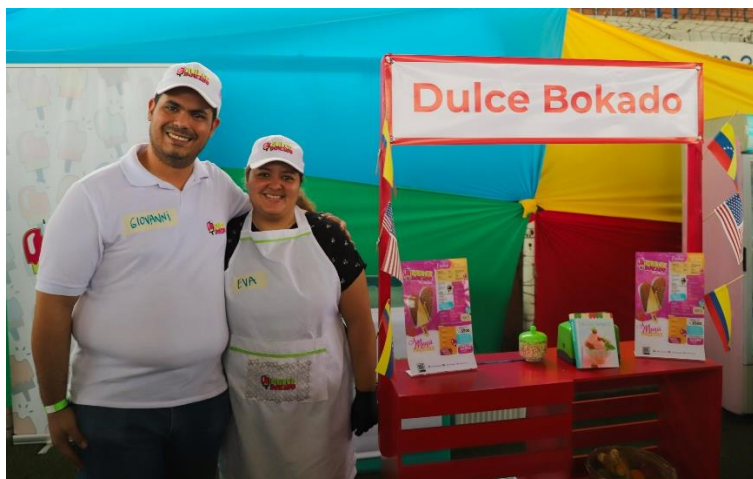
Presentación de unidades económicas de Integrando Horizontes, organizado por PRM y FUPAD en La Guajira.

Durante el mes de febrero, más de 8.300 beneficiarios recibieron una o más asistencias a través de 27 socios e implementadores del RMRP, en 16 municipios de 10 departamentos, tanto fronterizos como de permanencia de refugiados y migrantes. Se llegó a más de 6.600 personas por medio de la realización de actividades que promueven la cohesión social, tales como jornadas de integración comunitaria en sus respectivas comunidades de acogida. De igual manera, más de 1.100 refugiados y migrantes fueron acompañadas para acceder a oportunidades de empleo, y más de 500 en iniciativas de autoempleo o emprendimiento, incluyendo fortalecimiento de capacidades y entrega de insumos productivos, entre otras acciones. En apoyo al Ministerio del Trabajo, se realizaron jornadas de difusión del Permiso Especial de Permanencia para el Fomento de la Formalización (PEPFF), un mecanismo para facilitar la inserción laboral para los refugiados y migrantes en estatus migratorio irregular. Finalmente, 79 personas participaron en actividades relacionadas con inclusión financiera.