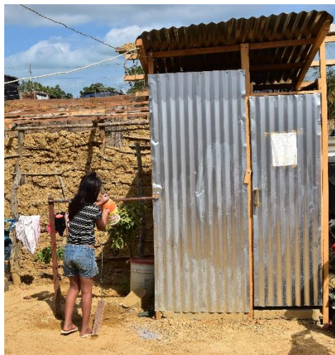
Familias de Riohacha, La Guajira, utilizan los 'tippy tap' contruidos entre hogares y ZOA, como nuevo mecanismo para el lavado de manos en zonas donde el agua es escasa.

Durante el mes de febrero, más de 41.700 beneficiarios recibieron una o más asistencias a través de 23 socios e implementadores del RMRP en agua y saneamiento, en 23 municipios de 13 departamentos, principalmente en departamentos fronterizos, pero también de manera puntual en departamentos de tránsito. Las principales acciones del sector comprendieron la entrega de kits y elementos clave de saneamiento e higiene para más de 20.800 refugiados y migrantes, considerando las necesidades diferenciales de mujeres, niñas, niños, adolescentes, madres gestantes, entre otros perfiles. Así mismo, se destaca el acceso diario a servicios de agua y saneamiento en puntos de prestación de servicios (centros de salud, albergues, comedores, escuelas, etc.) para más de 10.300 personas, entre ellas más de 5.500 niños, niñas y adolescentes que accedieron a dichos servicios en espacios de aprendizaje y espacios de desarrollo infantil. Continuando con la respuesta más de 4.900 personas - incluyendo población receptora- accedieron a instalaciones y capacitación sobre agua segura y saneamiento básico en sus comunidades, y más de 1.900 personas recibieron servicios de agua y saneamiento a nivel comunitario e institucional.