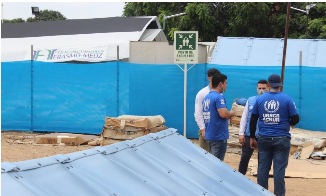
Instalación de los Refugee Housing Units en Norte de Santander, para apoyar la respuesta en salud y brindar zonas de aislamiento para la atención de pacientes positivos con COVID-19.