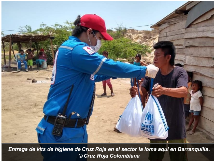
Entrega de kits de higiene de Cruz Roja en el sector la loma aquí en Barranquilla.