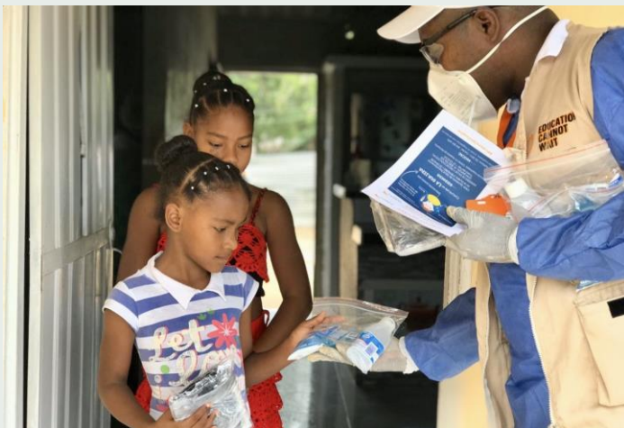
Atención a las comunidades Wayúu, afrocolombianos, refugiados, migrantes y comunidades de acogida, por medio de la entrega de kits de higiene para la prevención del COVID-19 en La Guajira.