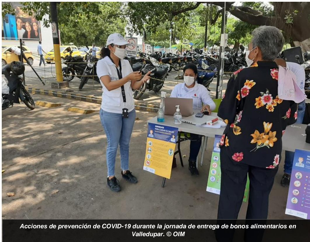
Acciones de prevención de COVID-19 durante la jornada de entrega de bonos alimentarios en Valledupar.