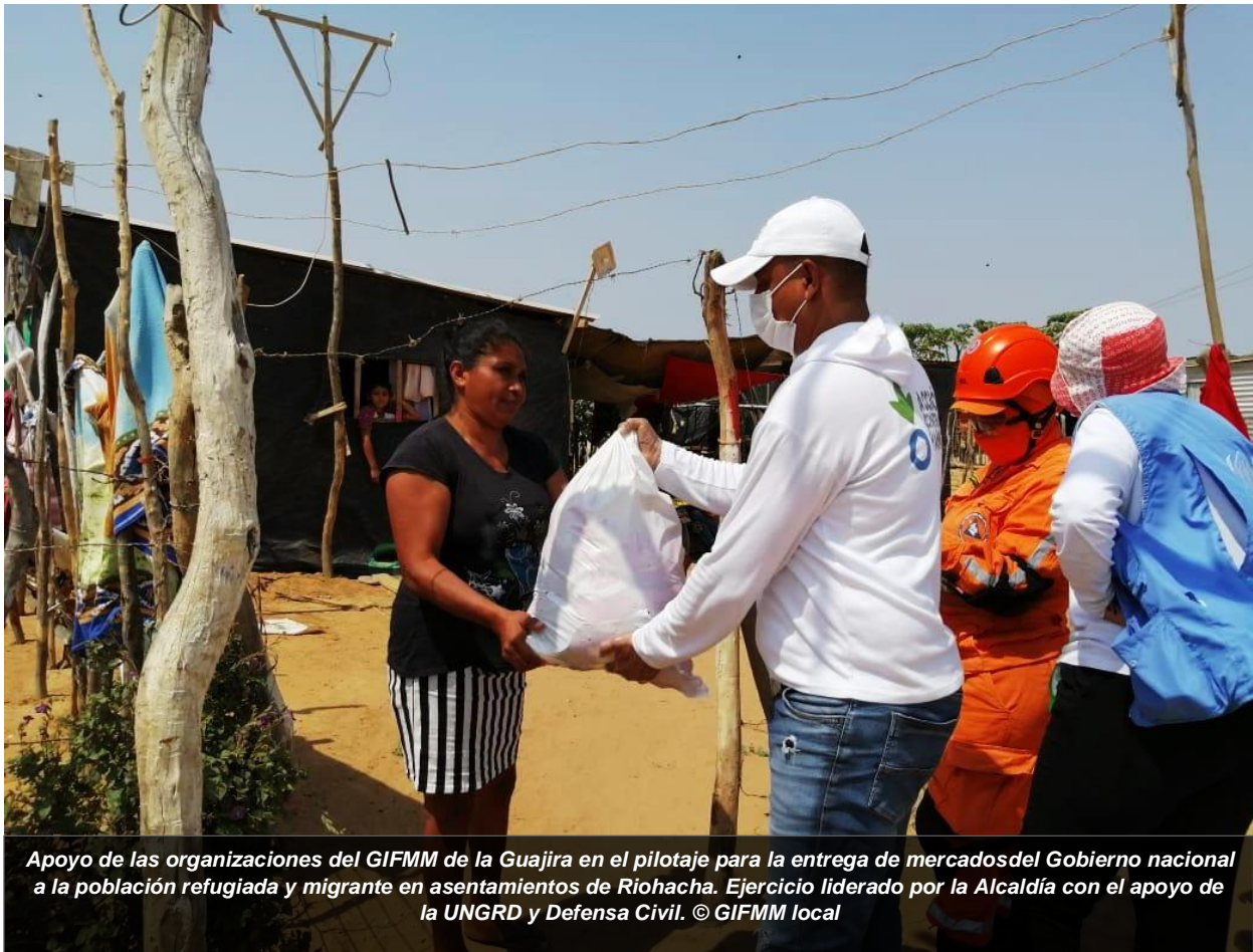
Apoyo de las organizaciones del GIFMM de la Guajira en el pilotaje para la entrega de mercados del Gobierno nacional a la población refugiada y migrante en asentamientos de Riohacha. Ejercicio liderado por la Alcaldía con el apoyo de la UNGRD y Defensa Civil.