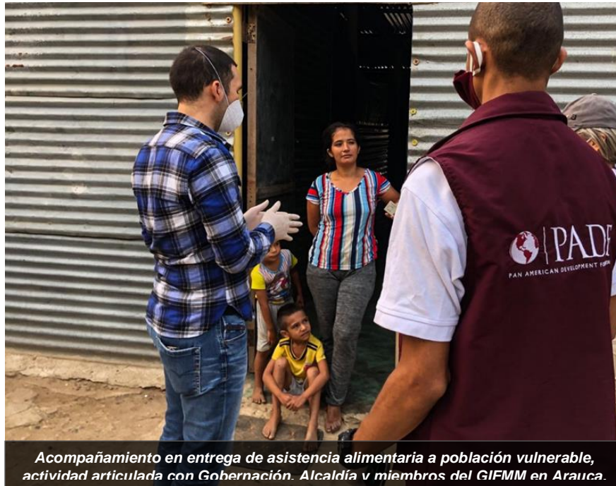
Acompañamiento en entrega de asistencia alimentaria a población vulnerable, actividad articulada con Gobernación. Alcaldía y miembros del GIFMM en Arauca.