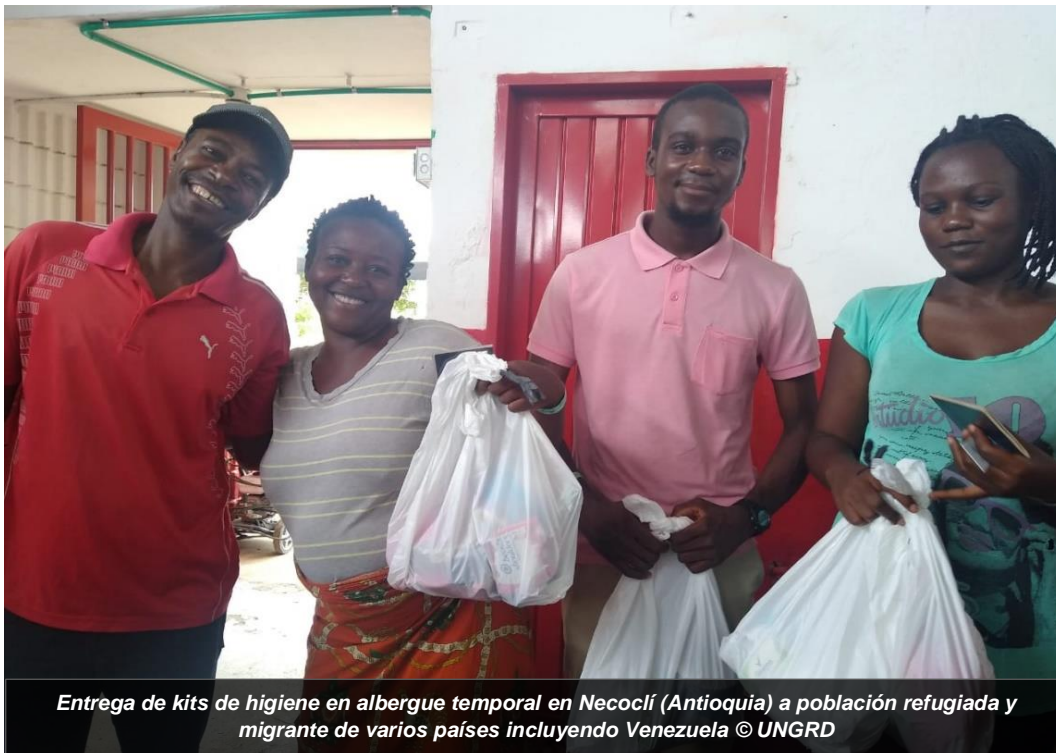
Entrega de kits de higiene en albergue temporal en Necoclí (Antioquia) a población refugiada y migrante de varios países incluyendo Venezuela