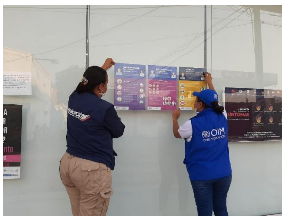
Afiches de información y orientación a la población refugiada y migrante, con consejos sobre cuidados sobre salud, y agua y saneamiento.

Más de 14.200 personas fueron contactadas a través de actividades de información y sensibilización sobre prevención, mitigación y respuesta de riesgos de protección de niños, niñas y adolescentes en contextos de flujos migratorios mixtos; y 9.100 refugiados y migrantes recibieron asistencia, representación o asesoría legal. De igual manera, más de 9.000 personas, incluyendo refugiados, migrantes y comunidades de acogida recibieron servicios a través de espacios de apoyo y más de 7.800 personas accedieron a otros servicios de protección, particularmente acompañamiento y orientación sobre acceso a derechos y rutas de atención. Así mismo, refugiados y migrantes accedieron a mecanismos de comunicación de doble vía para expresar sus necesidades, preocupaciones y dar retroalimentación.