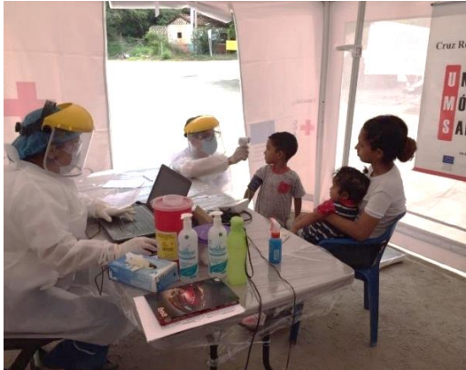
Atención en salud a refugiados y migrantes provenientes de Venezuela en el sector de Pescadero, en Santander.

Durante el mes de abril, más de 54.300 beneficiarios recibieron una o más asistencias a través de 43 socios e implementadores del RMRP, en 45 municipios de 24 departamentos, tanto de frontera como de tránsito y asentamiento de población proveniente de Venezuela. La prioridad del sector fue el apoyo en la prestación de servicios y adaptación de la respuesta para refugiados y migrantes, a fin de garantizar su continuidad mediante actividades como el seguimiento de casos, la vigilancia epidemiológica y la contratación de personal y adquisición de equipos médicos y elementos de protección, en coordinación con el Ministerio de Salud y el Instituto Nacional de Salud.