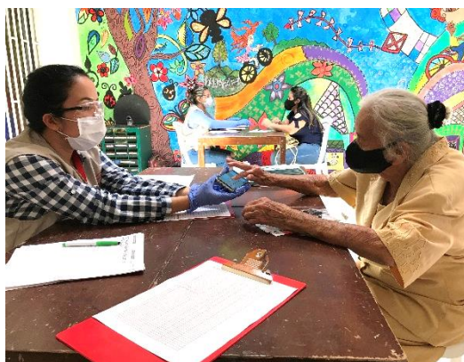
Entrega y orientación en transferencias monetarias a la población refugiada y migrante en Medellín, Antioquia.

Durante el mes de abril, más de 64.800 beneficiarios recibieron una o más asistencias a través de 15 socios e implementadores del RMRP, en 42 municipios de 14 departamentos. Estas personas fueron apoyadas a través de modalidades diversas de transferencias multipropósito, y las entregas vienen en su mayoría acompañadas de sesiones de sensibilización al uso de las tarjetas o mecanismos de entrega, además de orientaciones sobre prevención al COVID-19, tanto por vía telefónica como en las entregas en persona, que se desarrollan atendiendo las medidas de bioseguridad.