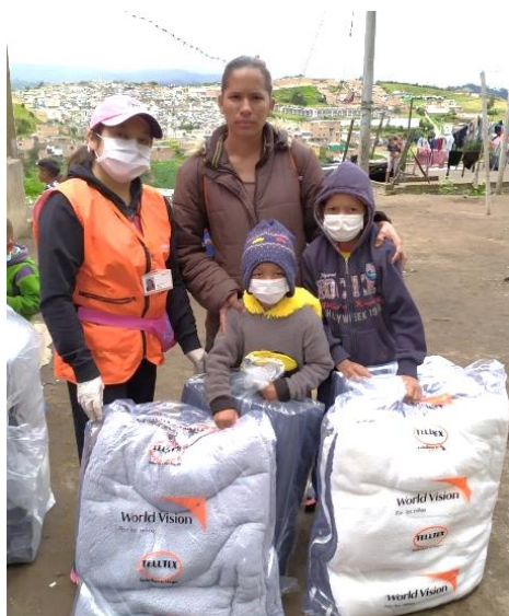
Entrega de mantas y colchonetas en asentamientos en Ipiales, Nariño.

Durante el mes de abril, más de 60.100 beneficiarios recibieron una o más asistencias a través de 15 socios e implementadores del RMRP, en 31 municipios de 15 departamentos, tanto en zonas de frontera como de tránsito y asentamiento de refugiados y migrantes. El subgrupo Multisectorial ha enfocado su respuesta en la adaptación y expansión de alojamientos temporales, pues las medidas de aislamiento preventivo han limitado su capacidad de recepción, así como la rotación de personas. La distribución de artículos de hogar se realizó en pequeña escala, y el transporte humanitario continúa suspendido.