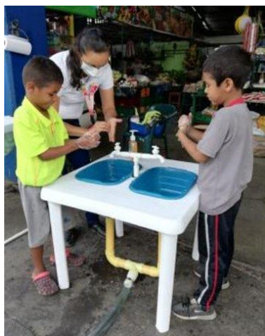
Adecuación de lavamanos con implementos de higiene como jabón antibacterial.

Durante el mes de abril, más de 56.400 beneficiarios recibieron una o más asistencias a través de 34 socios e implementadores del RMRP en agua y saneamiento, en 26 municipios de 12 departamentos, principalmente en departamentos fronterizos, pero también de manera puntual en departamentos de tránsito. Se destaca la entrega de insumos para la promoción de higiene enfocado en el lavado de manos, así como los procesos de limpieza y desinfección en lugares de interés de salud pública. Igualmente, el sector reabrió espacios en pasos fronterizos.