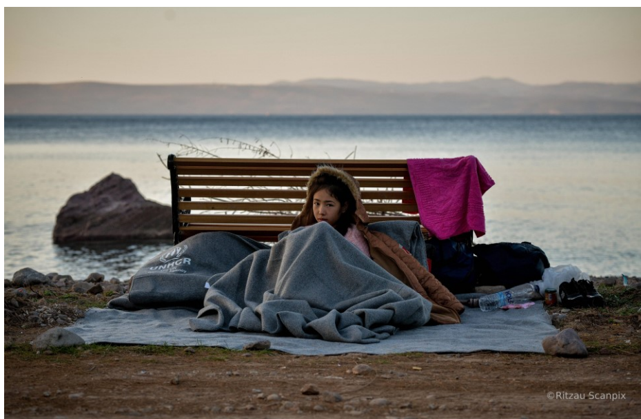
Πρόσφυγες που διέσχισαν με μια λέμβο τη θάλασσα από την Τουρκία, φθάνουν στο χωριό Σκάλα Συκαμιάς στο βόρειο τμήμα της Λέσβου.

9 Γραφεία σε Θεσσαλονίκη, Λέσβο, Χίο, Σάμο, Κω, Έβρο, Ιωάννινα, Λέρο και Ρόδο