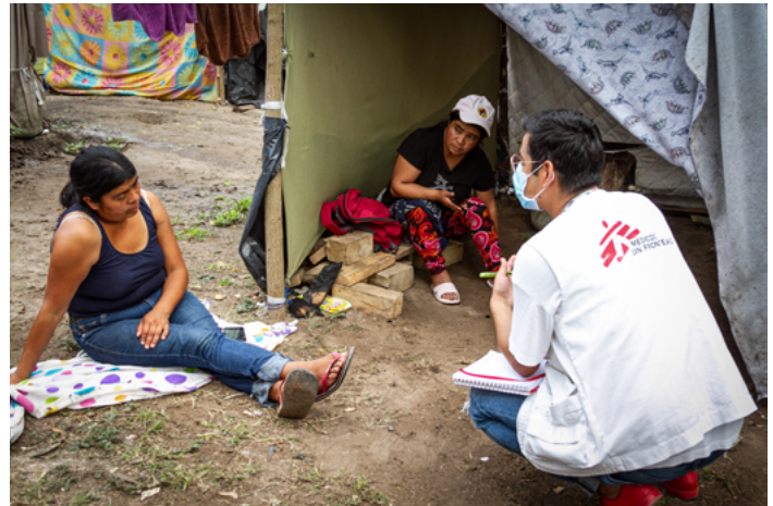
Actividades de promoción de la salud en el campamento de solicitantes de asilo de Matamoros. Crédito: MSF, 2020.

A pesar de que el derecho a la salud está garantizado para todas las personas independientemente de su estatus migratorio 169 y de avances significativos reflejados en el incremento en inversión pública 170 , la implementación del Seguro Popular en 2014 y su sustitución por el Instituto de Salud para el Bienestar (Insabi) en 2020 171 ; sigue siendo necesario redoblar esfuerzos para garantizar el acceso a un servicio más eficiente y de calidad , que garantice insumos médicos y personal capacitado 172 . Por ejemplo, el país cuenta con 8 camas hospitalarias y 27 miembros de personal de salud por cada 10 mil habitantes (mientras que la OMS recomienda tener 28 y 44 respectivamente); 12 médicos (incluyendo generales y especialistas), 1 odontólogo, 1 psicólogo y 2.6 promotores de salud por cada 10 mil habitantes (cifras también menores a las recomendadas); así como una crítica desventaja con respecto a la capacidad instalada con que cuenta el sur del país 173 . Así mismo, aunque el Insabi provee de atención médica a todas las personas, sólo garantiza la prestación gratuita de servicios de primer y segundo nivel. 174 Es decir que el tratamiento de alta especialidad es postergado por meses y a reserva de que se cubran contribuciones económicas que pueden ser solicitadas a los pacientes para cubrir su atención.