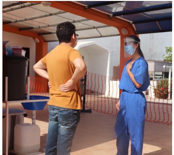
Un médico de MSF actualiza a los familiares sobre el estado de un paciente en el centro Covid-19 en Matamoros.

Las altas tasas de violencia sexual tienen consecuencias importantes en términos de salud para los centroamericanos/as, en particular las mujeres y niñas. Casi la mitad de las mujeres en pareja en El Salvador han experimentado, al menos una vez, violencia por parte de su pareja. 61 El 75% de las víctimas de agresión sexual en El Salvador en 2019 fueron menores de edad. 62 En Guatemala, durante el primer trimestre de 2019 se reportaron un promedio de 29 denuncias diarias por agresiones sexuales contra mujeres. 63 Desde 2016 a junio de 2019, Médicos Sin Fronteras atendió a 2,048 pacientes sobrevivientes de violencia sexual en Honduras: el 70% de ellas habían sido víctimas de violación, siendo el 86% mujeres, de las cuales el 51% eran menores de edad. 64 A pesar de estas cifras, Honduras y El Salvador no disponen de protocolos de atención a víctimas de violencia sexual que permitan ofrecer una atención adecuada y especializada a las niñas y mujeres que sufren este fenómeno. Además los países del NCA cuentan con legislaciones que criminalizan el aborto, convirtiendo a las víctimas en victimarias ya que pueden ser perseguidas, investigadas y encarceladas, bajo la sospecha de haber tenido abortos, aún si los embarazos son consecuencia de una violación. 65