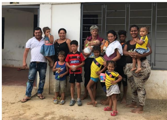
Venezolanos recién llegados a Las Delicias.

Ante el contexto actual de COVID-19, la generación de ingresos y los medios de vida de la población venezolana se han visto gravemente afectados . La mayoría de las personas refugiadas y migrantes se encuentran en situación de irregularidad, por lo que sus sustentos diarios provienen del ejercicio de actividades informales como las ventas ambulantes. Dada las medidas de aislamiento preventivo obligatorio tomadas por el Gobierno Nacional desde el mes de marzo, muchas familias se han visto expuestas ante la necesidad de retornar a su país en condiciones no favorables, ante el riesgo de permanecer en situación de calle y no poder cubrir sus gastos básicos para permanecer en Colombia.