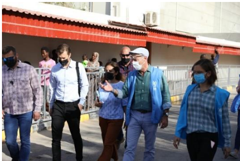
رئيس بعثة مفوضية اللاجئين يستقبل وفد الاتحاد الأوروبي في مركز التسجيل بطرابلس.

في الأسبوع الماضي، قُدم 111 تقييماً لاحتياجات الحماية و 18 تقييماً للمصالح الفضلى للقاصرين في المركز المجتمعي. كانت غالبية المحالين للخدمات الإضافية بعد التقييم الأولي من السودانيين، يليهم الإريتريون والسوريون والصوماليون والإثيوبيون. حتى الآن في عام 2021، قدمت مفوضية اللاجئين وشركاؤها 3,454 تقييماً لاحتياجات الحماية و 432 تقييماً للمصالح الفضلى للأشخاص المشمولين باختصاصها.