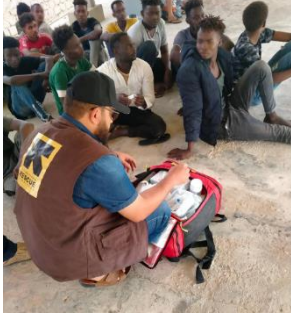
موظفو لجنة الإنقاذ الدولية يقدمون المساعدات الطبية في ميناء مصفاة الزاوية لنفطى عقب أحد عمليات الإنزال.

1 المنظمة الدولية للهجرة - مصفوفة تتبع النزوح: يونيو 2021 2 البيانات حتى تاريخ 12 أغسطس 2021