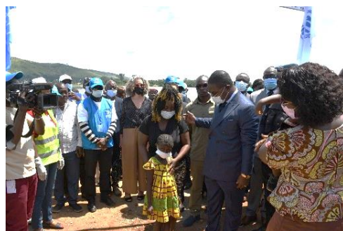
Le Premier Ministre Centrafricain, Henri Marie Dondra accueille une famille de réfugiés qui rentre en RCA au Port Amont, Bangui