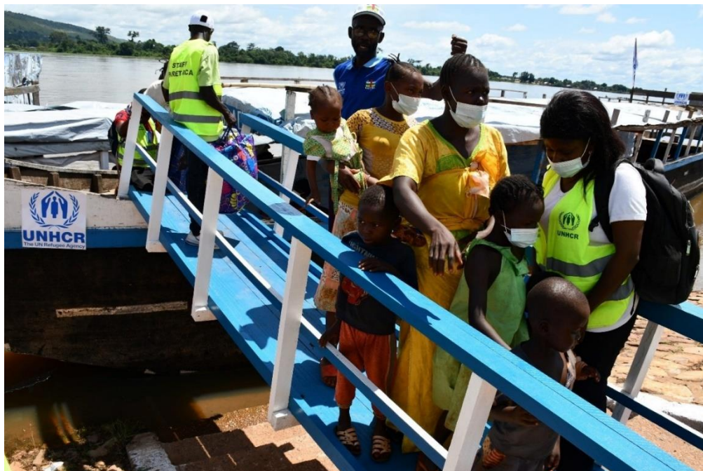
Des réfugiés centrafricains débarquent à Port Amont, Bangui, après avoir été rapatriés volontairement du camp de Mole, dans la province du Sud Ubangi

Dans la Province du Sud Ubangi, 81 réfugiés des camps de Mole et Boyabu ont reçu la deuxième dose du vaccin Astra Zeneca contre la Covid-19.