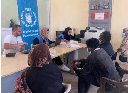
القيام بإجراءات طالبي اللجوء من قبل المفوضية والشركاء بعد إطلاق سراحهم.