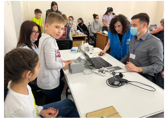
Înscrierea refugiaților la centrul de înscriere pentru asistență financiară din Chișinău, Republica Moldova

Comisia pentru Situații de Urgență a decis astăzi, 31 martie 2022, reorganizarea Centrului Unic de Gestionare a Crizei.