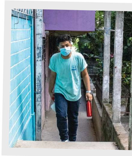
* Nombre cambiado por motivos de protección.