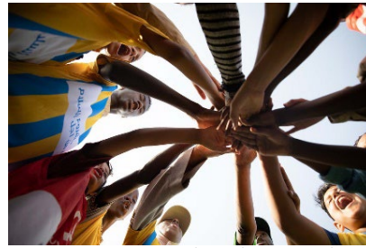
ميدان أبوسليم، انطلاق أنشطة الأطفال في إطار مشروع الرياضة من أجل السلام.

في فعالية في ميدان أبوسليم، ضمن فعاليات يوم اللاجئ العالمي وإيداناً بانطلاق أنشطة مشروع الرياضة من أجل السلام الذي تقوم عليه المفوضية. الفعالية - التي جمعت الكشافة الليبية ونازحين ليبيين ولاجئين - تضمنت كرة القدم وألعاباً ممتعة أخرى بهدف بناء روح الفريق. مشروع الرياضة من أجل السلام، المدعوم من قبل الجمهورية الهلينية، يركز على استخدام كرة القدم كوسيلة لتعزيز الإدماج والتماسك الاجتماعي بين فئات اليافعين المختلفة. تضمنت المرحلة الأولى من المشروع إعادة تأهيل ميدان أبوسليم وتصميم أنشطة المشروع. في المرحلة الثانية، ستنطلق الأنشطة الرياضية مع الأطفال والشباب وسيقوم عليها مدربون مؤهلون، وهي مصممة لتعزيز التعايش السلمي وتطوير المهارات الحياتية.