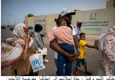
طالبو اللجوء قبيل رحلة إجلائهم إلى إيطاليا.

في 30 يونيو، أجلت مفوضية اللاجئين 95 من طالبي اللجوء واللاجئين المستضعفين عبر رحلة جوية من ليبيا إلى إيطاليا، وهي رحلة الإجلاء الثانية إلى إيطاليا هذا العام. رحلات إعادة التوطين جارية أيضاً، وهي تساعد بعض اللاجئين الأكثر ضعفاً على مغادرة ليبيا بحثاً عن الأمان. في 29 يونيو، نقلت مجموعة مكونة من 18 لاجئاً عبر رحلة جوية إلى خارج ليبيا لتتم إعادة توطينهم في أوروبا. منذ عام 2017، نقل 8,485 لاجئاً وطالب لجوء جواً من ليبيا عبر رحلات إعادة التوطين والإجلاء أو عبر المسارات التكميلية.