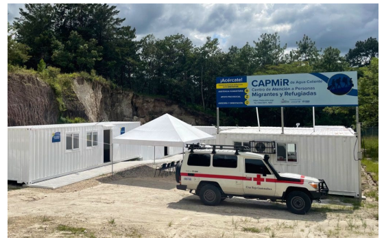
Centro de Atención a Personas Migrantes y Refugiadas de Agua Caliente en Esquipulas.