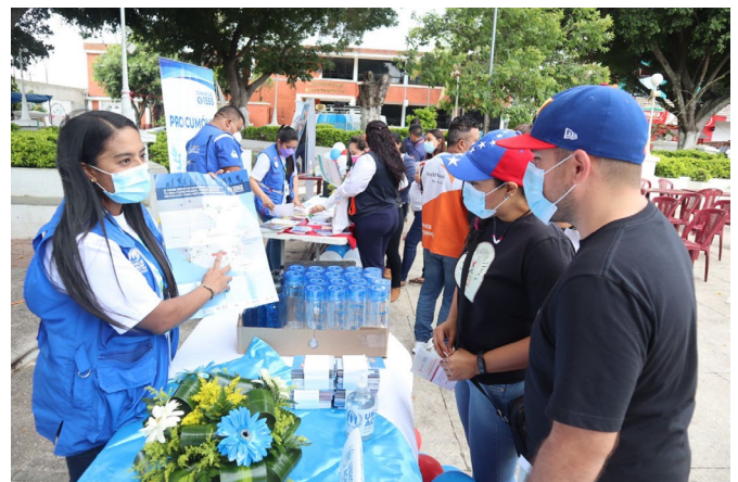
Feria informativa en Jutiapa por el Día Mundial del Refugiado.

32 Personas participantes en programas de medios de vida para la empleabilidad o el emprendimiento.